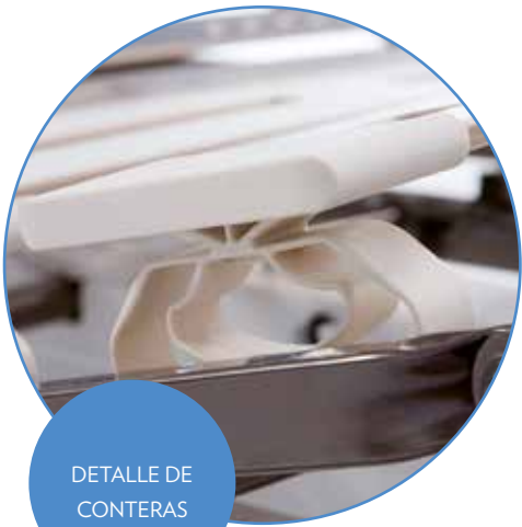
DETALLE DE CONTERAS