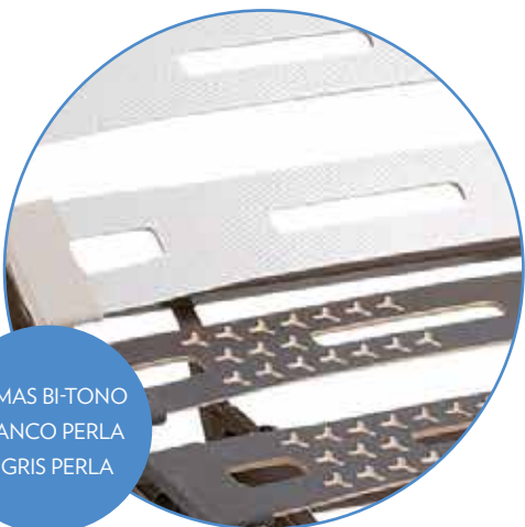
LAMAS BI-TONO BLANCO PERLA Y GRIS PERLA